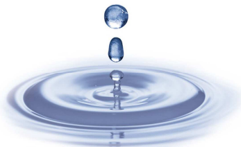
Schéma d'Aménagement et de Gestion des Eaux Delta de l'Aa